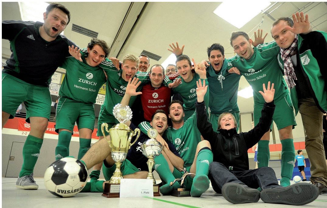
War das ein Start ins neue Jahr: Der SuS Legden sicherte sich mit einem 3:1-Sieg gegen Eintracht Ahaus erstmals den Sieg beim großen Hallenturnier der SpVgg in Vreden.