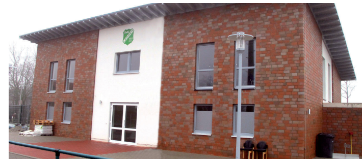
Stein auf Stein hieß es im Spätsommer (Foto unten links) - im Dezember, noch vor dem Schneefall, wurde das Dach gerichtet - im Juni 2011 überrascht Claus Berkemeier den SuS mit einer Materialkostenübernahme durch die RWE (Foto oben rechts) - am Sonntag präsentiert sich das neue Umkleidegebäude der Öffentlichkeit.