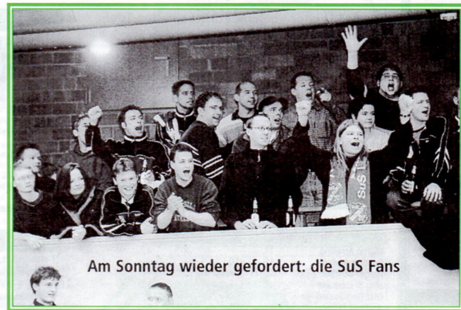
Am Sonntag wieder gefordert: die SuS Fans