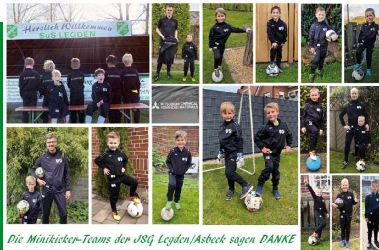
Die Minikicker-Teams der JSG Legden/Asbeck sagen DANKE

Die Vereinszeitung des SuS Legden 1911 e.V.